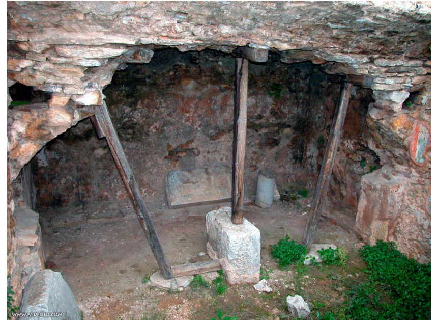
Das Gefängnis von Philippi (?)

35 Na het aanbreken van de dag stuurden de pretoren de lictoren om te zeggen: ‘Laat die mensen vrij.’ 36 De cipier bracht die woorden aan Paulus over: ‘De pretoren hebben laten weten dat u moet worden vrijgelaten. U kunt dus gaan en in vrede verder reizen.’ 37 Maar Paulus zei tegen hem: ‘Ze hebben ons, hoewel we Romeins burger zijn, zonder vorm van proces in het openbaar gezeseld* en ons in de gevangenis gezet, en nu willen ze ons in stilte wegsturen? Geen denken aan! Laten ze zelf maar hier komen om ons in vrijheid te stellen.’ 38 De lictoren brachten deze woorden over aan de pretoren. Die werden bang toen ze hoorden dat het Romeinen waren. 39 Dus gingen ze naar hen toe, stelden hen in vrijheid en verzochten hun dringend de stad te verlaten. 40 Toen ze de gevangenis verlaten hadden gingen ze naar Lydia; ze troffen daar de broeders, spraken hen bemoedigend toe en vertrokken