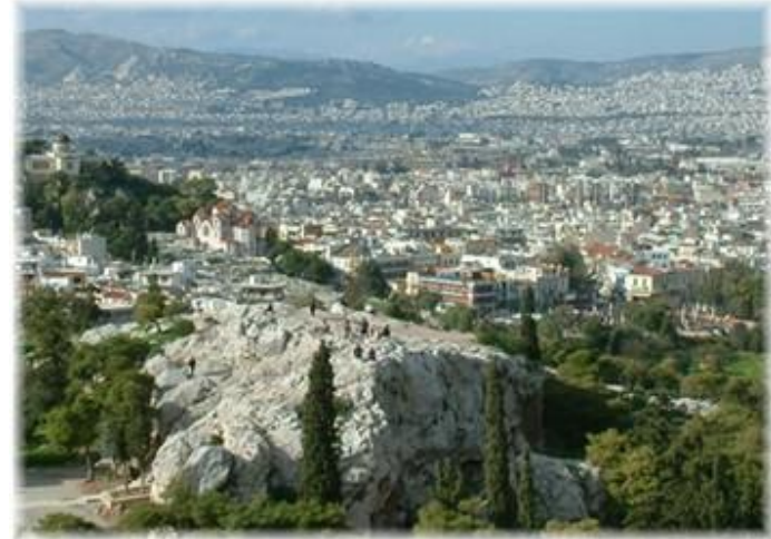
Der Areopag, von der Akropolis aus gesehen

25 Ook laat Hij zich niet door mensenhanden bedienen, alsof Hij iets nodig had, want zelf geeft Hij aan allen leven en adem en alles