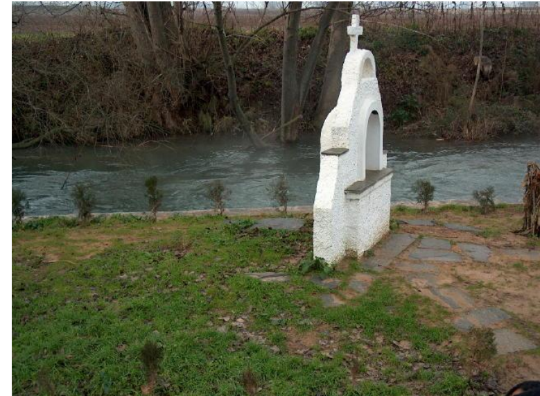
Der heutige Ort der Lydia-Kapelle

13 Op de sabbat gingen we de poort uit naar de rivier waar, dachten wij, de gebedsplaats was. We gingen er zitten en spraken de vrouwen toe die daar samengekomen waren. 14 Er zat ook een vrouw te luisteren die Lydia heette, een godvrezende vrouw uit de stad Tyatira, die in purper deed. De Heer opende haar hart, zodat ze in de ban raakte van Paulus' woorden. 15 Toen zij zich met haar huisgenoten had laten dopen, nodigde ze ons uit: 'Als u mij beschouwt als iemand die in de Heer gelooft, neem dan ook uw intrek bij mij.' En zij drong er bij ons sterk op aan.