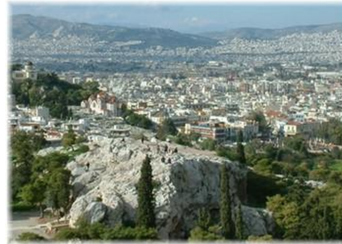
Der Areopag, von der Akropolis aus gesehen