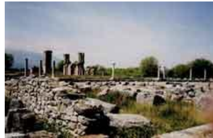
Das antike Philippi