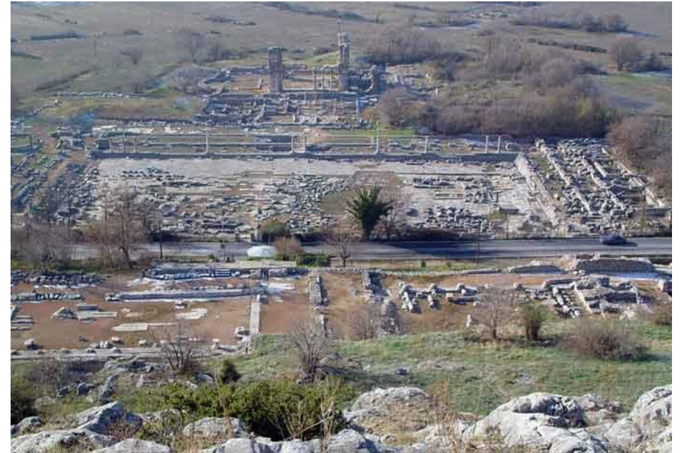
Die Ausgrabungen von Philippi

16 Onderweg naar die gebedsplaats kwam er eens een slavin op ons af die een helderziende geest had en met haar waarzeggerij voor haar eigenaren veel geld verdiende. 17 Zij liep Paulus en ons achterna en schreeuwde aldor: ‘Deze mensen zijn dienaren van de allerhoogste God. Ze verkondigen u de weg naar de redding.’ 18 Dat deed ze vele dagen achtereen. Toen het Paulus te veel werd, draaide hij zich om en zei tegen de geest: ‘In naam van Jezus Christus beveil ik je uit haar weg te gaan.’ Op dat ogenblik ging hij weg.