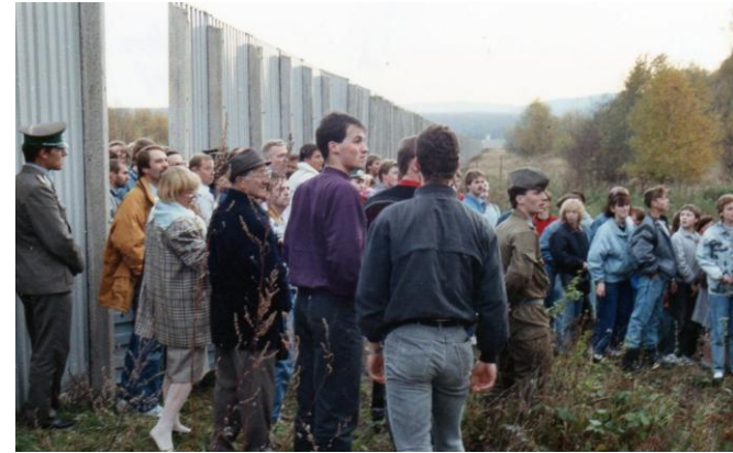
Eckertal (Bad Harzburg) 11. 11. 1989

Want Hij is onze vrede, Hij die de twee werelden één gemaakt heeft, en de scheidsmuur heeft neergehaald, door in zijn vlees de vijandschap.