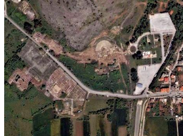
Die Via Egnatia bei Philippi

Das Christentum befreit Europa vom Unrechtsregime; im Glauben wird die Unterscheidung zwischen Politik und Religion begründet.