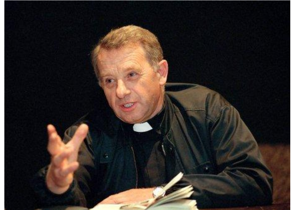
Józef Tischner (1931 – 2000)

„Was kann Westeuropa einem aus dem GuLag Entlassenen derzeit anbieten? Was haben ihm Existenzialismus, Strukturalismus, Psychoanalyse, Hermeneutik und Sprachphilosophie und nicht zuletzt auch der Neuthomismus zu sagen? Wird ihm als erstes geraten, sich von seinem Alptraum ablenken zu lassen? Wird man ihm weismachen, daß das Bild Gottes vor Auschwitz mit jenem danach identisch ist und der Mensch jetzt nach den GuLags der gleiche geblieben ist? Will nun Westeuropa ernsthaft darauf bestehen, daß nun alles vorbei ist und bald vergessen sein wird? Waren also wirklich alle Totalitarismen nichts weiter als ein Betriebsunfall, der dem europäischen Verstand zwar einmal passiert ist, ihn aber nicht daran hindern wird, unbeirrt am Bau der künftigen glücklichen Welt weiterzubasteln?“