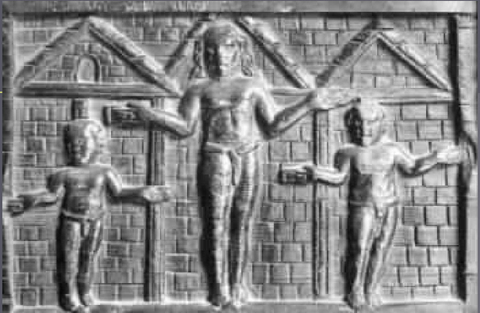
Santa Sabina, holzgeschnitzte Eingangstür (außen) , Rom, ca. 432 n. Chr.